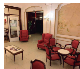
HOTEL LA SALLE