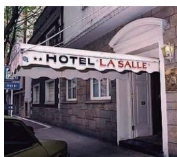
HOTEL LA SALLE