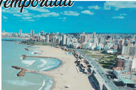
MAR DEL PLATA