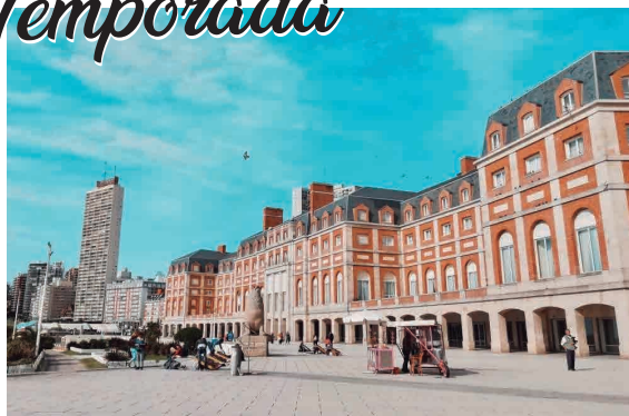
MAR DEL PLATA